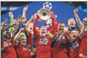
سرمربی لیورپول به مسجل

شدن اولین قهرمانی این تیم پس از سسی سنال واکنشی جالب نشان داد و گفت داور بازی چلسی و منچسترسییتی کار آنها را در آخر بازی خراب کرد!